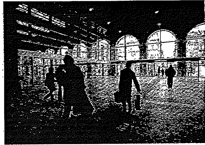
L'atrio di Porta Nuova che si affaccia su corso Vittorio

NOVELLI E STRIPPOLI ALLE PAGINE II E III