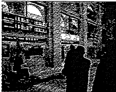
Un particolare del nuovo atrio

Ma la nuova versione di Porta Nuova è diversa soprattutto dal punto di vista estetico. «A me piace considerarla un po' come un'opera d'arte», dice l'architetto Moretto. Per buona parte degli interni è stato semplicemente rivitalizzato il colore originale delle mura della stazione, ma sono stati anche posizionati tanti elementi dalla tinta vivace, sia nella galleria creata nella porzione che dà verso via Sacchi, che nell'atrio che dà verso i binari: «Qui il soffitto prima era tutto nero - spiega il direttore artistico - così abbiamo scelto di alleggerirlo con questo grigio-argento. Poi abbiamo piazzato questi pannelli colorati. Sono duecento metri quadrati di pannelli, che hanno quelli che secondo me sono i colori della città: c'è il verde della collina, il rosso della passione, il blu della montagna. Vuole essere un po' un